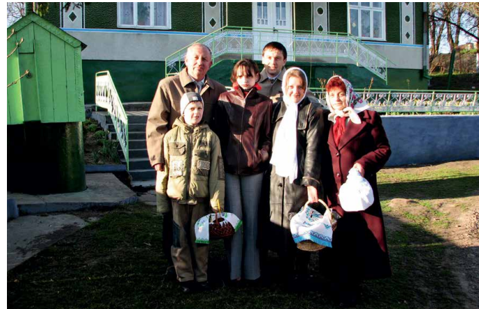
2007 рік. Обельниця. Великдень в родинному колі.