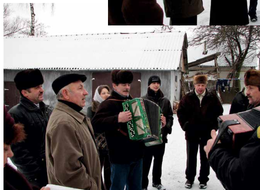
2008 рік. Коляда в селі Обельниці.