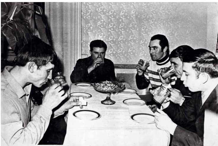
1969 р. Кашперівка. Молодіжний вогник.