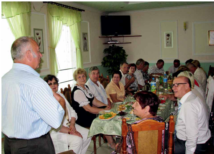
2012 рік. Кашперівка. Зустріч з колишніми учнями.